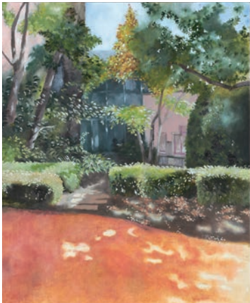
青少年奨励賞 楠瀬 くらら 〈うららか〉