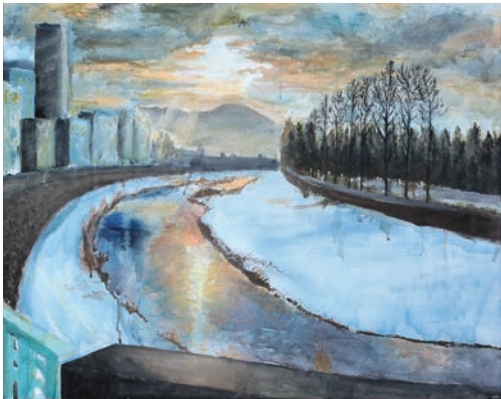
青少年優秀賞 長沼 実桜里 〈寒くて、あたたかい〉