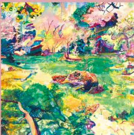
高橋 周平《心まるごと湧き上がる》2024年(部分)