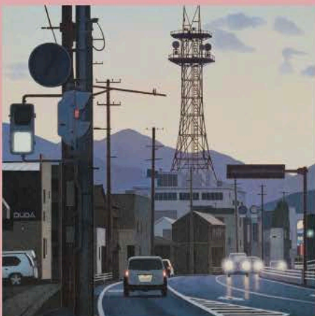
多田 耕二《故郷の山へ》2021年(部分)