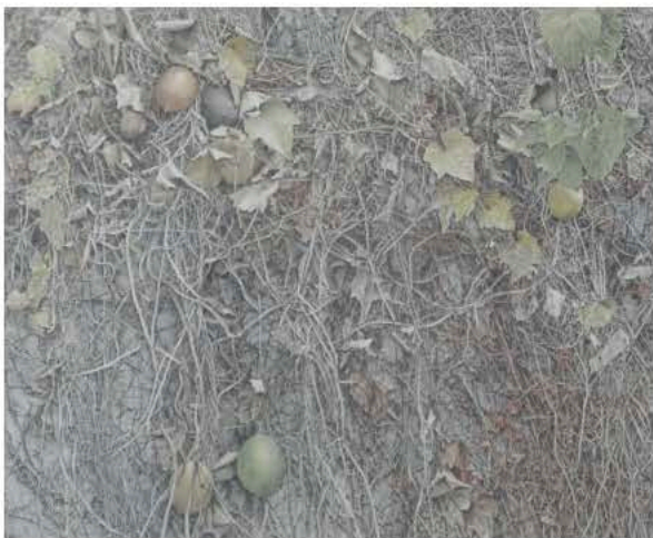
浅野英明 《系譜》 2010年