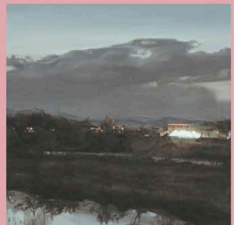
大塚 弘《対岸のネオン工場》2023年(部分)