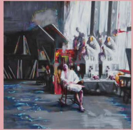
貞栗 毅《絵画室のまどろみ》2017年(部分)