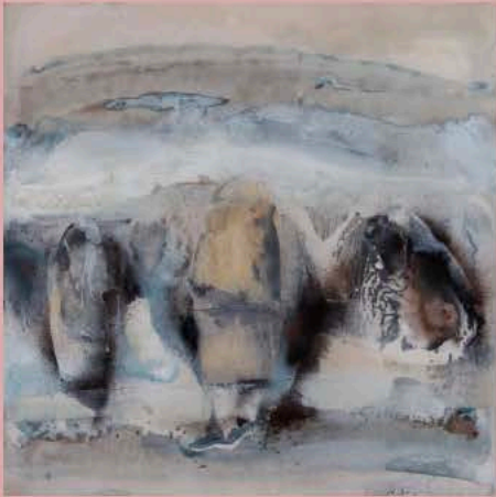
鷺 邦明《春を待つ》2018年