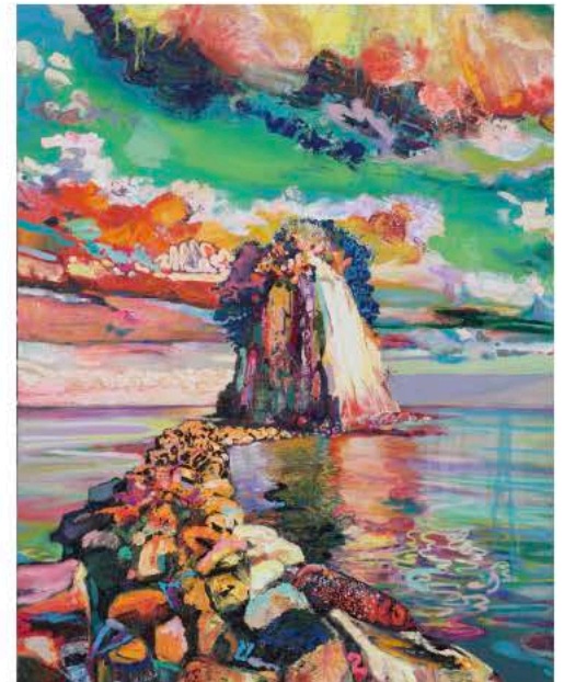
高橋周平 《魂が呼んでいる》 2025年