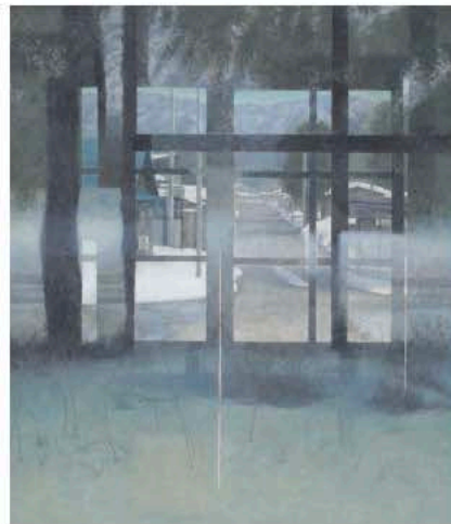
山川智隆 《並行する世界》 2024年