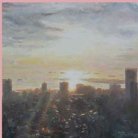
吉田 努《照映》2022年(部分)