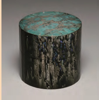
須藤靖典 《紙胎消粉透かし時絵漆箱 雪水り》 2022年 銀粉、鮑貝、常色