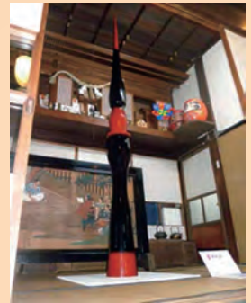
井波純 《Stupa》2010年 漆・麻布・木 (会津・漆の芸術祭 2010 未廣酒造 嘉永蔵会場にて)