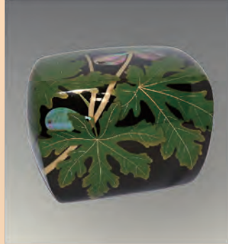
佐藤達夫 《乾漆イチジク時絵箱》2021年 漆・螺鈿