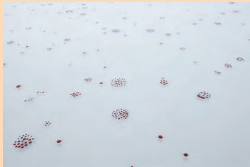
伊藤将和 《朱点-memento mori-》2011年 赤漆・硝子(部分)