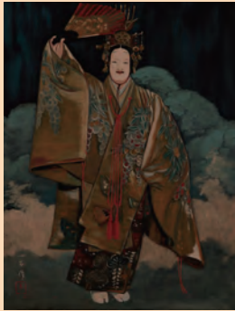
宮村源治 《能》漆絵 制作年不詳 漆・板

本展覧会では、会津にゆかりのある作家11名の作品を紹介します。伝統工芸としての漆作品、現代の感性に則した創造性豊かな作品など、作家たちが漆と対話し、生み出された表現を漆そのものの魅力とともに楽しみください。