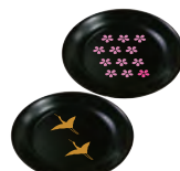
※完成作品イメージ