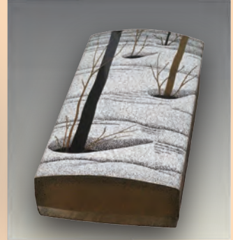
二瓶和男 《机上箱 雪ゆるむ》制作年不詳 漆・卵殻