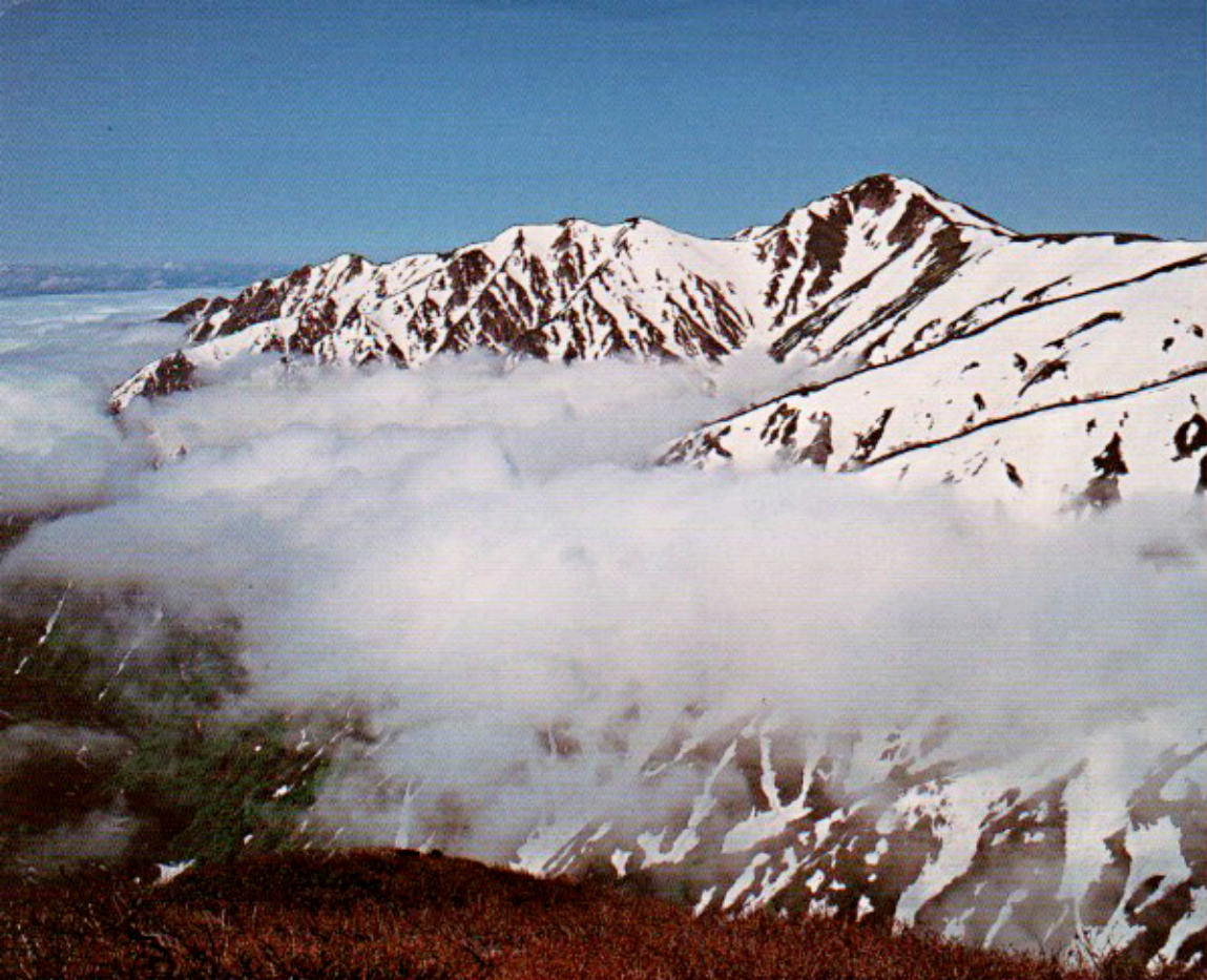
①(大日岳・春) 1991年 撮影場所: 御前坂