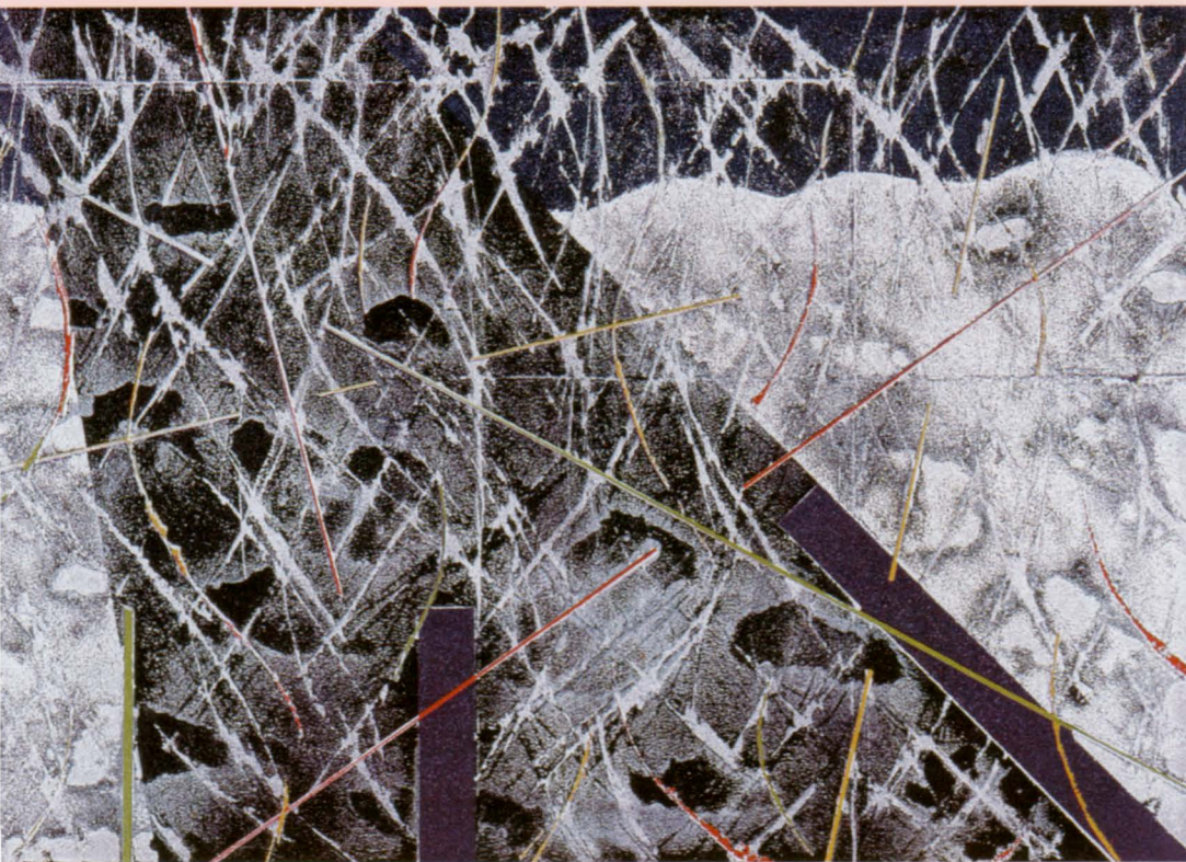
長谷川雄一〈雪の夜〉制作年不詳