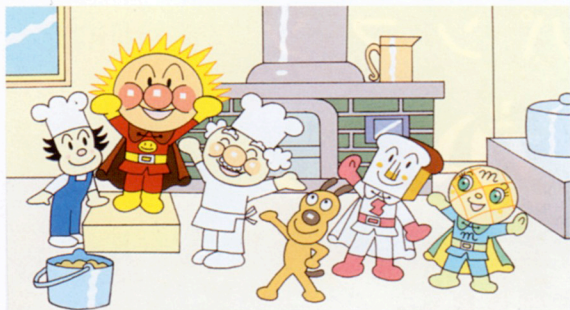
アンパンマンとあおいみだ ☆