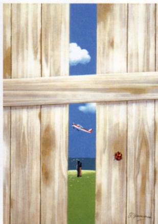
古板塀すき間をぬけて風かおる ☆