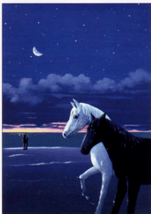
デュエットで馬いなくや朝の海 ☆