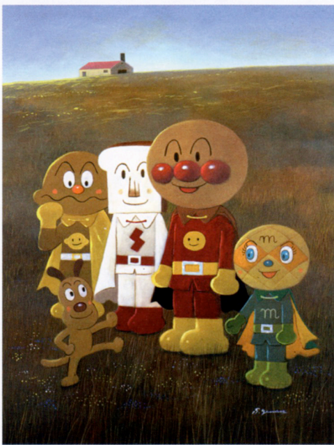
アンパンマンとたのしい仲間たち ☆